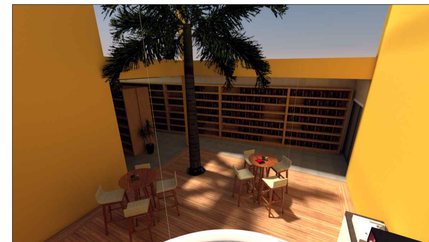
Perspectivas Internas sem escala