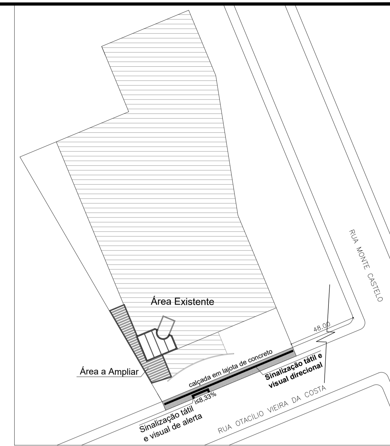
Planta de Situação e Localização escala:1/500